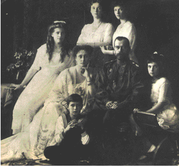
El zar Nicolás II y su familia.

poblaciones polacas. Las condiciones de vida de los obreros son durísimas, si cabe más que la de los campesinos.