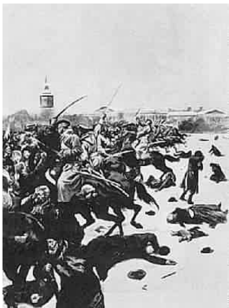
Represión del domingo sangriento .

En 1905 el Imperio Ruso va a sufrir una fuerte sacudida como consecuencia de su estrepitosa derrota en la guerra con Japón de 1904-1905 en Extremo Oriente, de la crisis económica y del hambre.