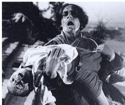
Fotograma de la película El acorazado Potemkin , de Eisenstein. 1925.

El partido socialdemócrata (marxista) se va a ir organizando en unas asociaciones secretas de obreros llamadas soviets y su misión es controlar los sectores claves de la economía y las comunicaciones del país para, en un momento dado, conquistar el poder político. El primer soviet es el de San Petersburgo y estaría dirigido por León Trotski. Poco a poco se van extendiendo los soviets por otras ciudades y van a crear un auténtico poder en la sombra. Trotski se da cuenta que si dominan las ciudades dominan el país. Su momento les llegará en octubre de 1917.